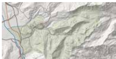
– relief ombré avec éléments vectoriels