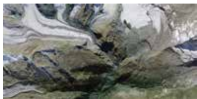
– photo aérienne