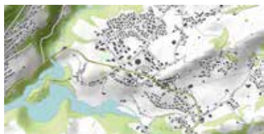
– vectoriel avec topographie