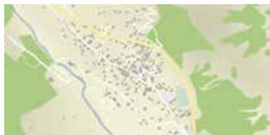
– vectoriel couleur ou noir-blanc