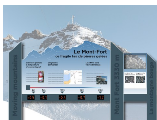
Visualisation d'un poste d'interprétation sur la permafrost prévu au Mont Fort.