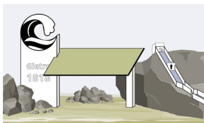
Visuel d'un poste d'interprétation interactif