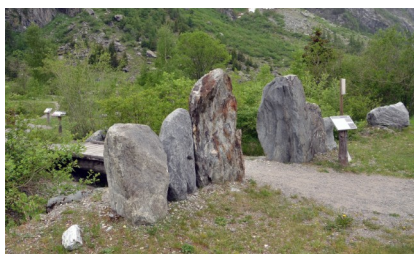
Jardin des roches de Bonatchiesse