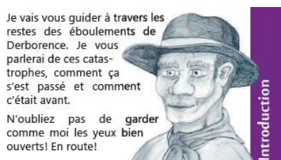
Extrait de la brochure tout public. Le texte est introduit par Antoine, le Berger, rescapé de l'éboulement, personnage issu du livre de C.-F. Ramuz « Derborence »,